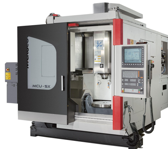
Microcut VA20/5 / MCU5X